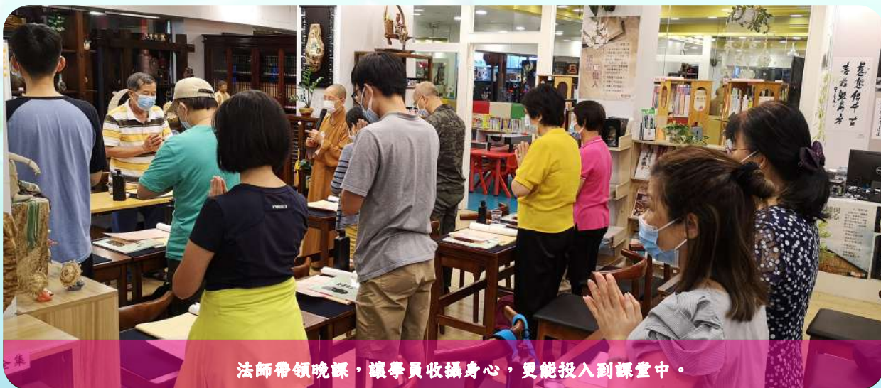
法師帶領晚課，讓學員收攝身心，更能投入到課堂中。