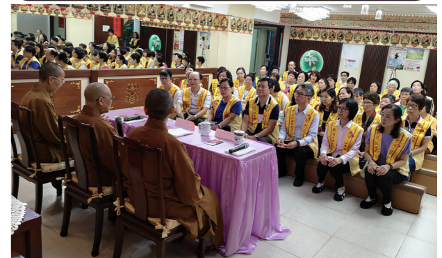
佛光人用心聆聽，增強弘揚人間佛教的信心。