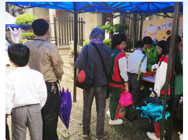
大眾冒雨參與遊戲，認識三好及蔬食救地球。

佛光青年為參加者講說日常生活中如何實踐三好及四給，現場參與者普遍對蔬食的理念有所認同。澳門佛光青年團每年參與這項活動，期望參加的兒童及青少年遠離外在的毒品，同時能進一步透過三好淨化內心，令人間佛教的種子植入大眾心中。