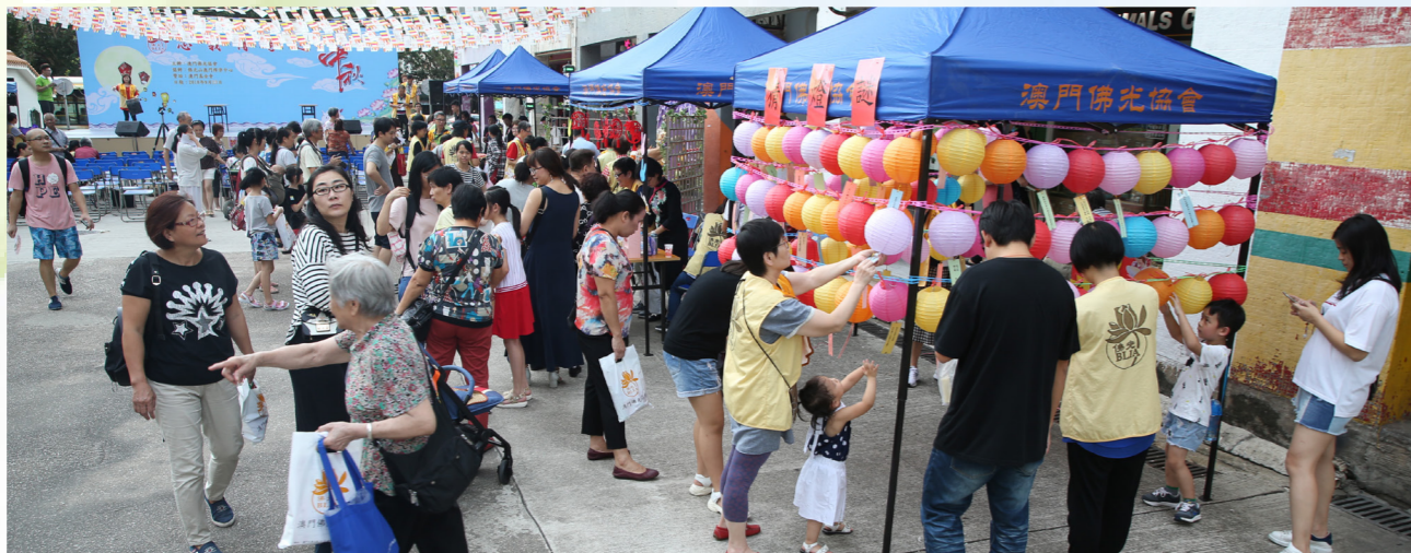
中秋節前夕，澳門佛光協會與眾市民共迎佳節，市民猜燈謎認識佛法，大會亦藉此傳承傳統中華文化。

貫徹佛光山開山星雲大師的人間佛教理念，澳門佛光協會特於 2018 年 9 月 23 日（農曆八月十四）下午四時半，假氹仔花城公園側之空地（近成都街）舉行「忠義傳家迎中秋」活動，與近 400 名市民提早慶祝中秋這個傳統佳節；宣揚做好事、說好話、存好心的三好精神，希望市民在慶祝人月兩圓的佳節同時，能令自心像月亮一樣圓融，進而使家庭和順、社會和諧，現場氣氛熱絡溫馨。