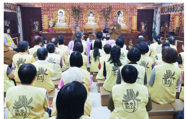
永富法師期勉佛光人把人間佛教的理念傳承下去。